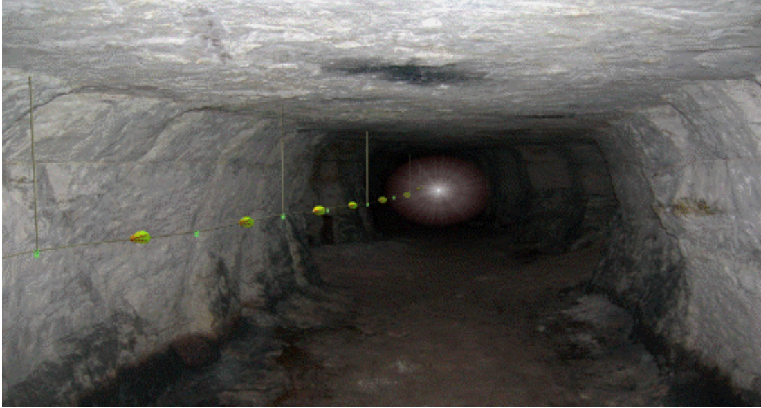
Şekil-1: Hayat hattı görünümü

18. (Ek:RG-10/3/2015-29291) (3) Yeraltı madenlerinde, hazırlık faaliyetlerinin yapıldığı alanlar ve üretim panoları gibi yeraltı maden işletmesinin bütün bölümlerini kapsayacak şekilde ve çalışanların yerüstüne çıkmalarını kolaylaştıran; yanmaya, kopmaya ve aşınmaya karşı dayanıklı bir hayat hattı kurulur (Şekil-1 ve Şekil-2). Bu hatlar acil durum planlarına uygun olarak yerleştirilir.